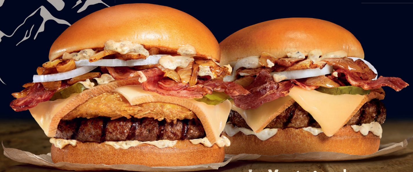
Le Rösti Montagnard