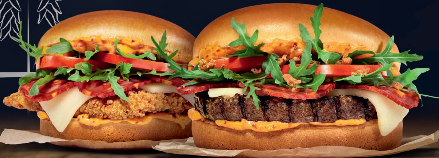
Le Basque Poulet