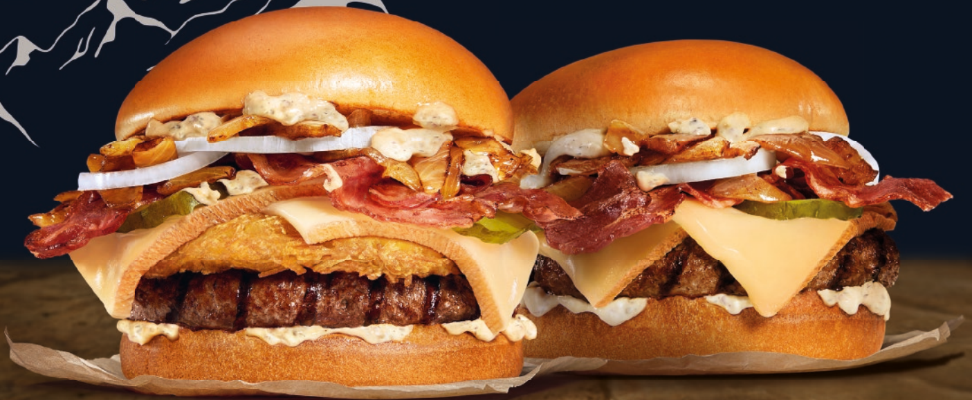
Le Rösti Montagnard